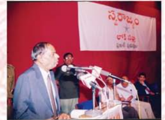
ఆవిష్కరించిన గవర్నర్ రంగరాజన్

2012లో పార్లమెంటు స్టాండింగ్ కమిటీకి ప్రతిపాదనలు లోక్ సత్తా ప్రతిపాదనలకు బిల్లులో స్థానం